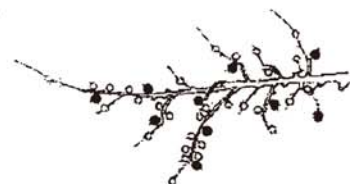
4頂芽に1果（着果数は10果）