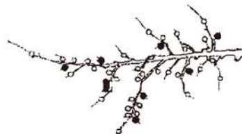
5頂芽に1果（着果数は8果）