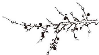
5頂芽に1果（着果数は8果）