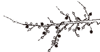
4頂芽に1果（着果数は10果）